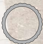
Poste aluminio Ø 60x5 mm