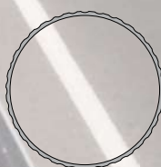
Poste aluminio Ø 78x3 mm